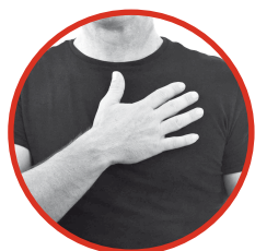
rechte Hand patscht auf den Brustkorb